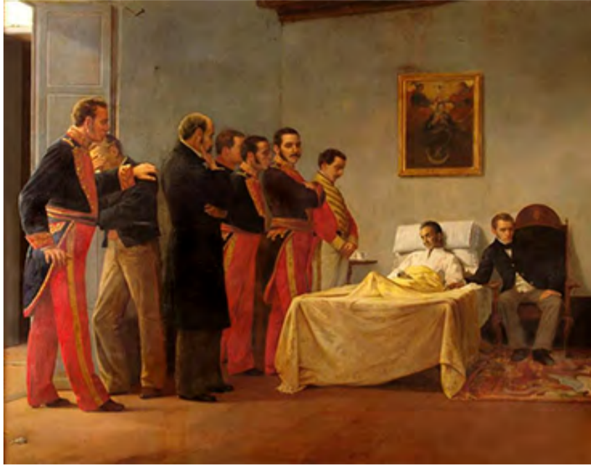
MUERTE DE BOLÍVAR – ANTONIO HERRERA TORO

En primer lugar, con rigurosidad histórica, en dicho texto hacía un recuento de la vida de Simón Bolívar, narrando a rajatabla cada aspecto de su existencia en su justo contexto, sin disminuir ni exagerar, presentando únicamente la controvertida vida de este relevante hombre público. Luego, a partir de este sucinto esbozo biográfico, elaboraba —evocando al filósofo Nietzsche— las bases de lo que he llamado “el devenir espectral de Bolívar”. Un proceso en el que se creó un dios con pies de barro del mismo nombre y presunta identidad del afamado militar y político, al cual, en su deificación, se le extirpó cualquier