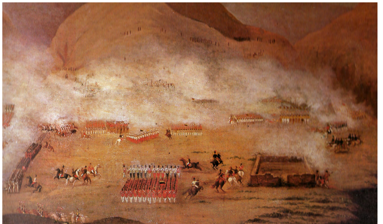
BATALLA DE AYACUCHO – ANÓNIMO / MUSEO NACIONAL DE ARQUEOLOGÍA, ANTHROPOLOGÍA E HISTORIA, PERÚ

Entre los ejercicios gargáricos realizados por los funcionarios historiográficos, está el de señalar como uno de los nobles motivos que impulsaron a con-