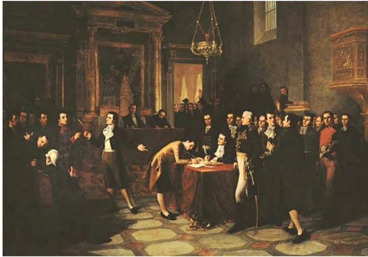
FIRMA DEL ACTA DE INDEPENDENCIA / MARTÍN TOVAR Y TOVAR

Las fuentes jurídicas rectoras en dicho período virreinal, desde lo resuelto por la Reina Isabel I de Castilla, o Isabel La Católica 5 , serán las