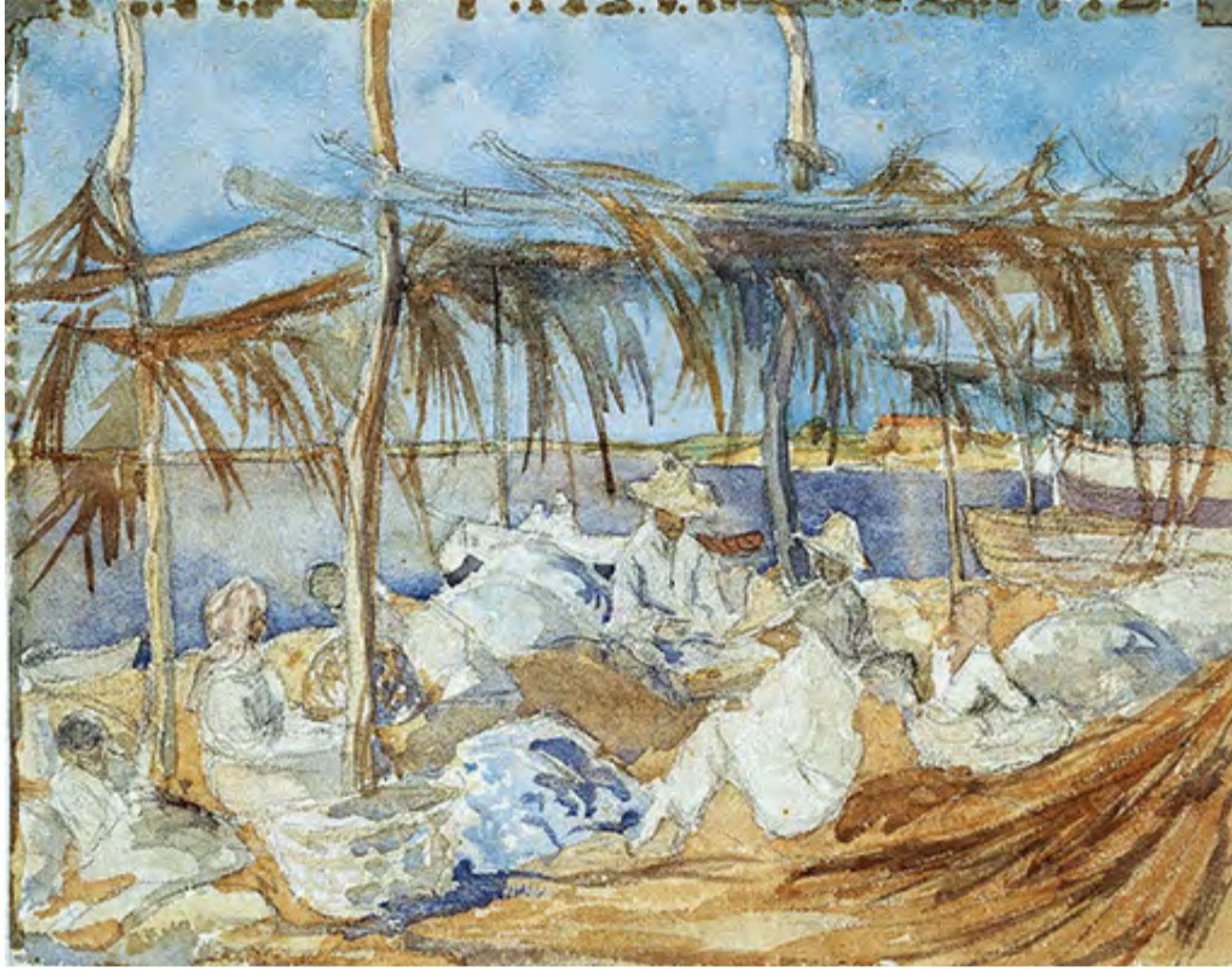
PESCADORES DE PERLAS EN PORLAMAR (1918)

Pareciera que en ese carácter de la tierra –su riqueza, superficial y profunda–, Venezuela tiene un núcleo mítico, donde se halla también el germen trágico de su destino. Al menos desde que tiene uno, cuando fue (re)nombrada. En cuanto a la isla que nos ocupa, los guaiquerías la llamaban Cua Hua , isla de los cangrejos, que han debido ser quienes la poblaron hasta que fue vista por Colón. Antes de ser fundada Nueva Cádiz, la isla de los cangrejos no podía tener algo tan trágico y occidental como un destino; lo que sí es seguro es que no era explotada, con suerte se podría decir que en ella ha-