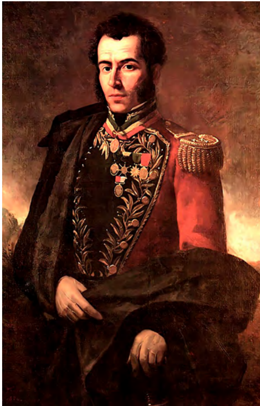
ANTONIO JOSÉ DE SUCRE, EL GRAN MARISCAL DE AYACUCHO / MARTIN TOVAR Y TOVAR

¿Acaso no existía ya una unidad previa en tiempos de la monarquía hispánica, en términos políticos, jurídicos, administrativos, económicos y monetarios, por no hablar del sustrato fundamental de la lengua fran-