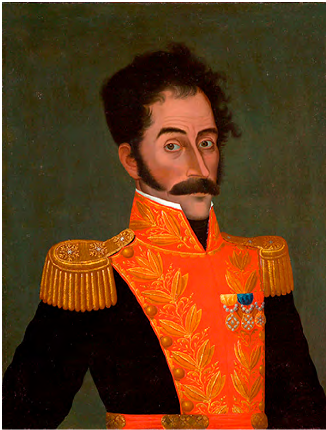
SIMÓN BOLÍVAR – JOSÉ GIL DE CASTRO