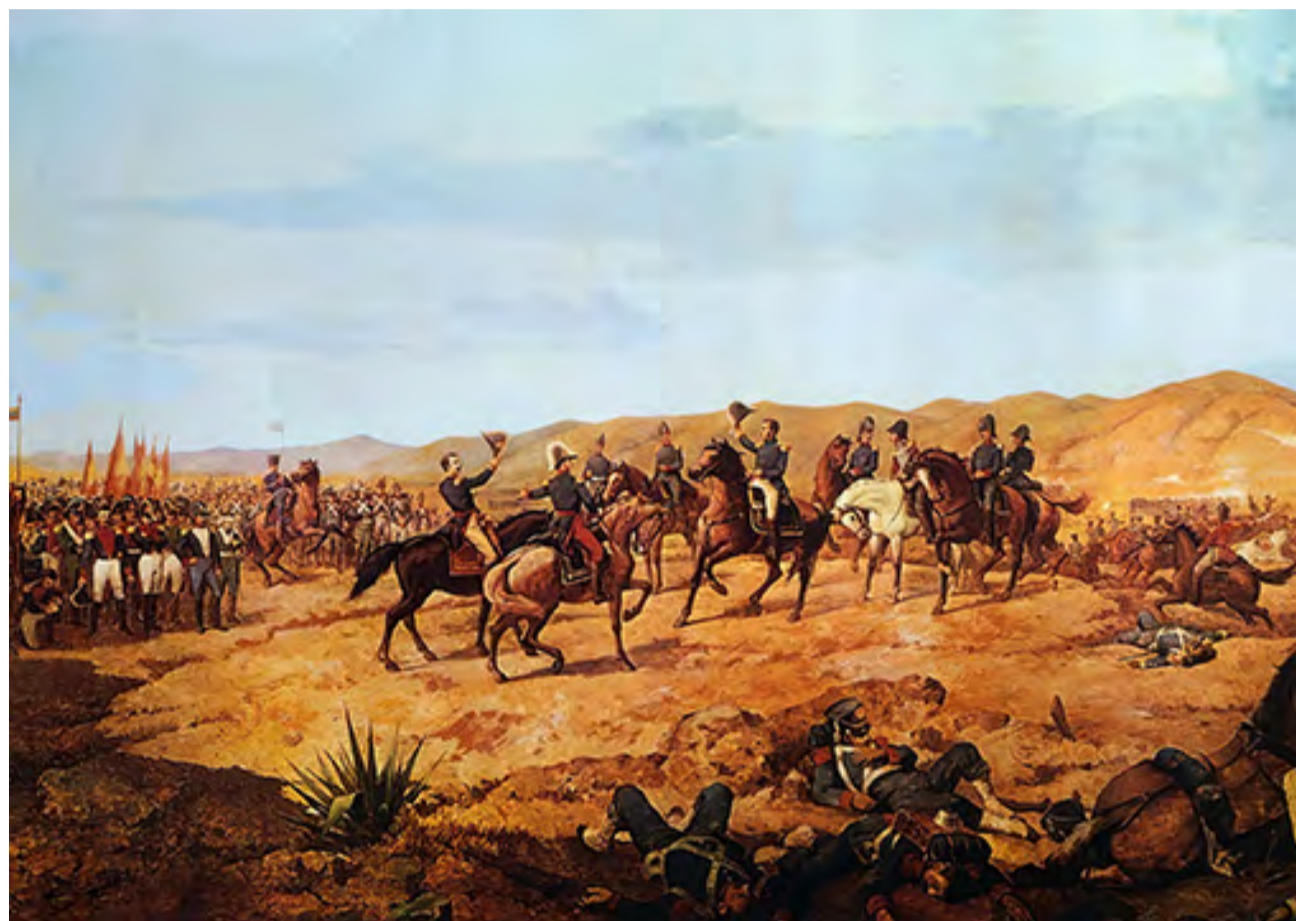
BATALLA DE AYACUCHO – MARTÍN TOVAR Y TOVAR / PALACIO FEDERAL LEGISLATIVO, CARACAS, VENEZUELA

Nuestras repúblicas, en mayor o menor medida, se erigen sobre la estigmatización, la minusvaloración y el olvido de lo hispano. ¿Por qué es