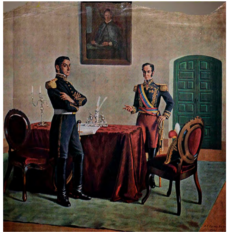
REUNIÓN ENTRE SAN MARTÍN Y BOLÍVAR – PABLO DUCROS / EMBAJADA DE VENEZUELA EN ARGENTINA

La pasión por la libertad y gobierno propio, a cualquier costo, nos impidió comprender que la fuerza y unidad de las distintas sociedades del mundo hispánico se sustentaba en la Monarquía Hispánica, ubicada en un territorio de menor extensión, como argumentamos con arrogancia, pero un poderosísimo factor de poder en el