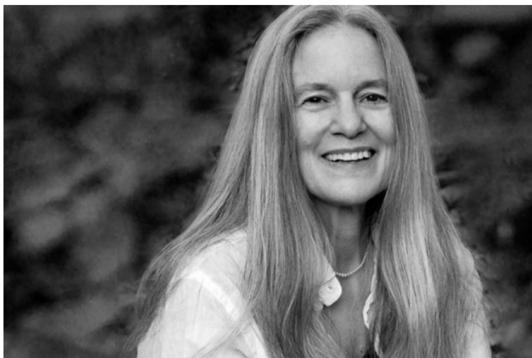
SHARON OLDS