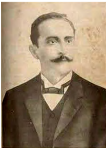
ELÍAS DAVID CURIEL

“Curiel no logró reunir los poemas en libros durante su vida, estos fueron publicados en la prensa local y otros en El Cojo Ilustrado , importante medio de difusión del modernismo de América”