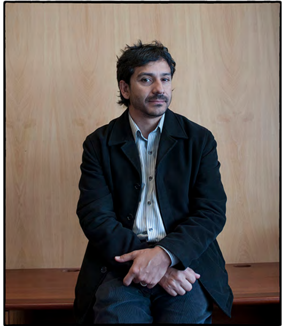
GUSTAVO VALLE / ©VASCO SZINETAR