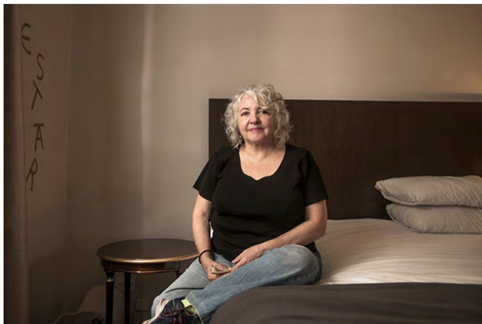
BLANCA STREPPONI

Un pastor de ovejas que ve amenazado su trabajo por la llegada de la minería, que “dice la verdad y sabe que ha perdido”; un cantante callejero de tangos de ochenta años que “canta