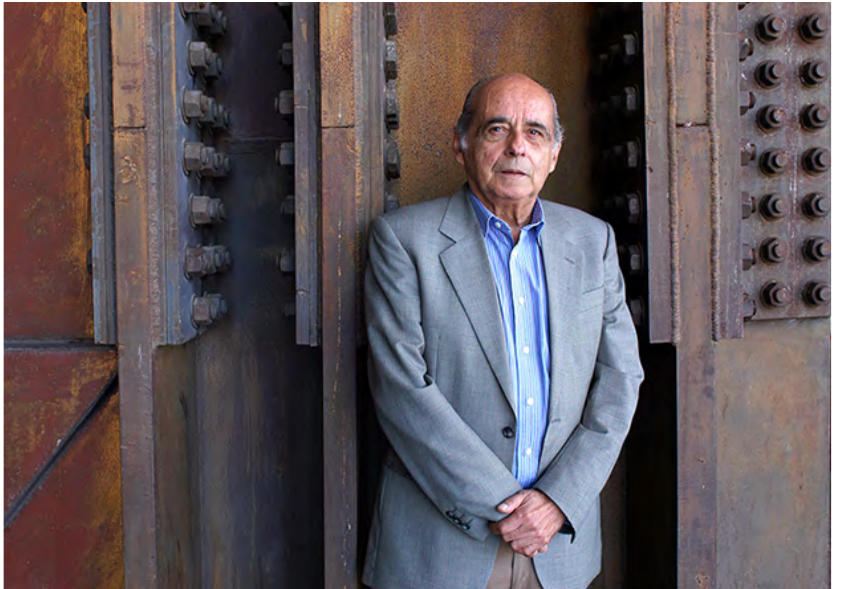
CARLOS GERMÁN BELLI / ©VASCO SZINETAR

Bien en tapiz de liso plexiglás, o cual arena por el austro fresca, al más áspero suelo trocaremos del lícito planeta suburbano, a donde alguna vez huir podremos, pues hoy hasta el gollete nos hallamos, a fe en el ajo desde vivo horno, do nunca escalfan huevos, sino montes de dura piedra no, más sí de carne.