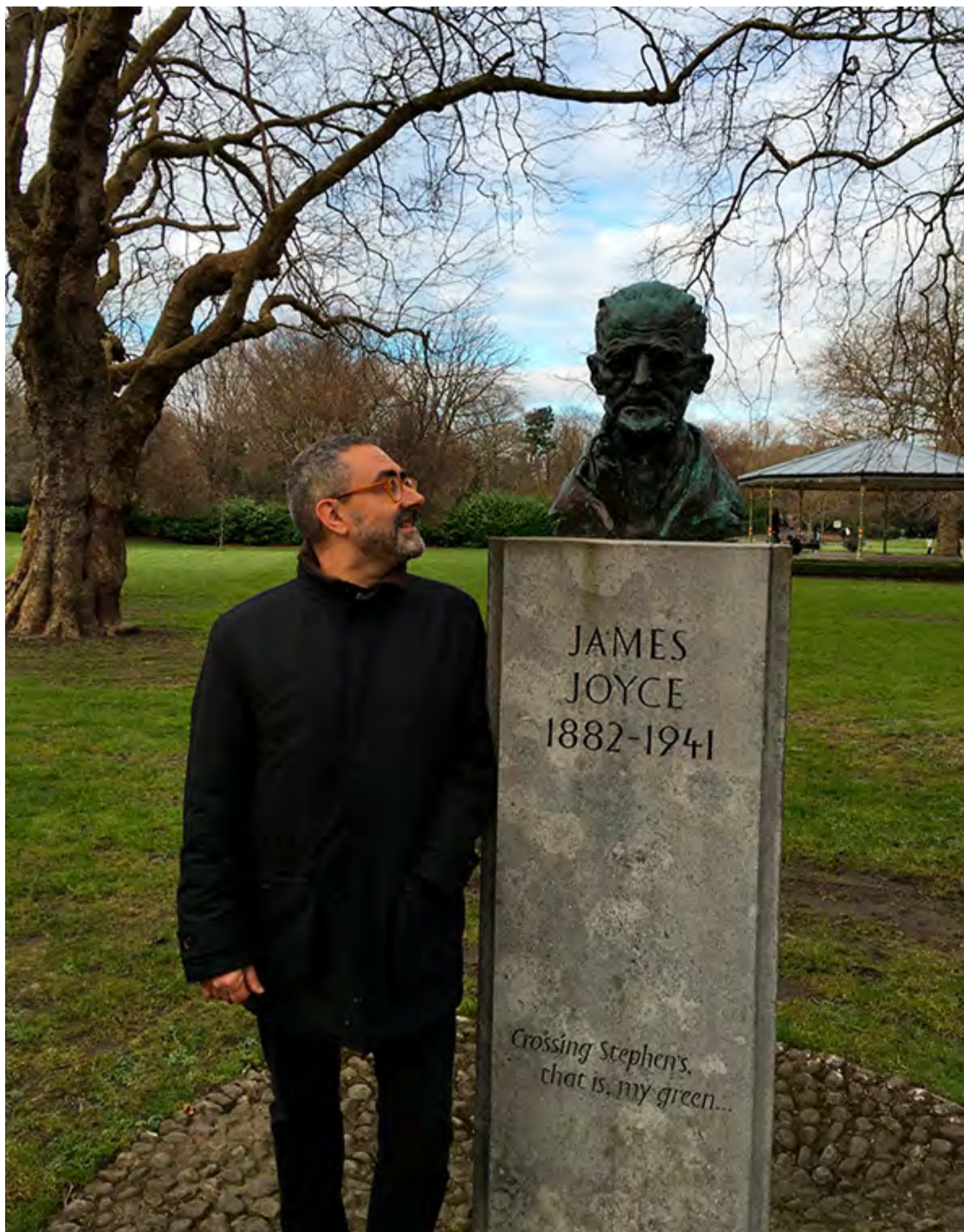
ANTONIO RIVERO TORAVILLO / FUNDACIÓN JOSÉ MANUEL LARA