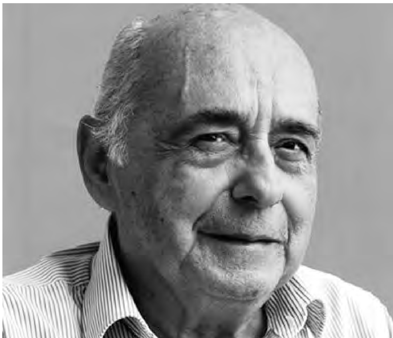
CARLOS GERMÁN BELLI / EDITORIAL MUNICIPAL DE ROSARIO, ARGENTINA

Nos educaron contra la métrica. Contra la métrica y el ritmo. Pulcros y solitarios imberbes tentamos el soneto, como un cojo galope que tiene por campo una pieza de tres por tres. Al salir más allá, vinieron los círculos, los poetas y los no poetas mezclados en la poesía, en la antipoesía, en el verso libre, en el poema visual, en la vanguardia; el resultado fue que olvidamos esa prístina voz de la cual siempre se desconoce procedencia. Mala época para el oído. Parte de esa voz, seguramente, enturbiada por la formación general a la que fuimos sometidos en el aula de clases en las unidades de Lenguaje o Castellano, donde era recurrente la posición obtusa ante el eterno soneto de Quevedo "amor constante más allá de la muerte" o un poema aleatorio de los 20 poemas de amor de Neruda, y así se entendía el poema en una forma concatenada de endecasílabos, ignorando la perfecta conjunción entre palabra y sonido. No había pasión en la transmisión de esa poesía que, está de más decir, no sobrevivía a la disección de los maestros en búsquedas de las diversas figuras literarias. La voz que nos llamaba era producida en la fricción entre el ritmo de las palabras y el lenguaje en su más alta cúspide, dando cuenta de una figura natural, un sonido familiar en el habla cotidiano que recoge la trascendencia de los días con sutileza única.