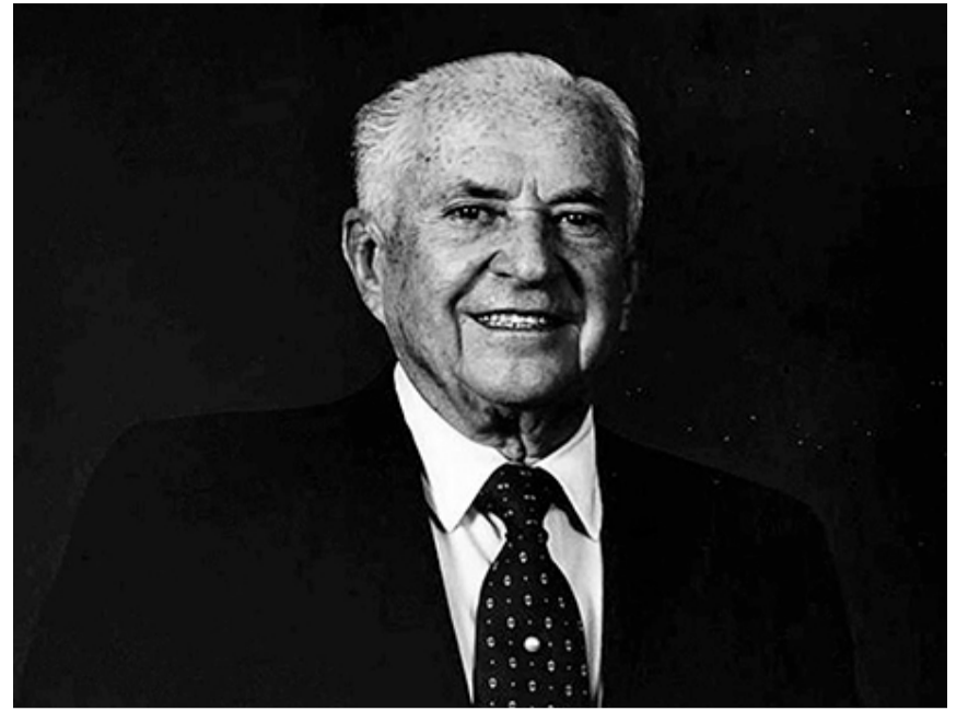
CARLOS LANDER MÁRQUEZ / REVISTA DEBATES IESA

Para la AVE el tema presentado era ya conocido, pues en 1963 ya el suscrito lo había presentado su tesis sobre la