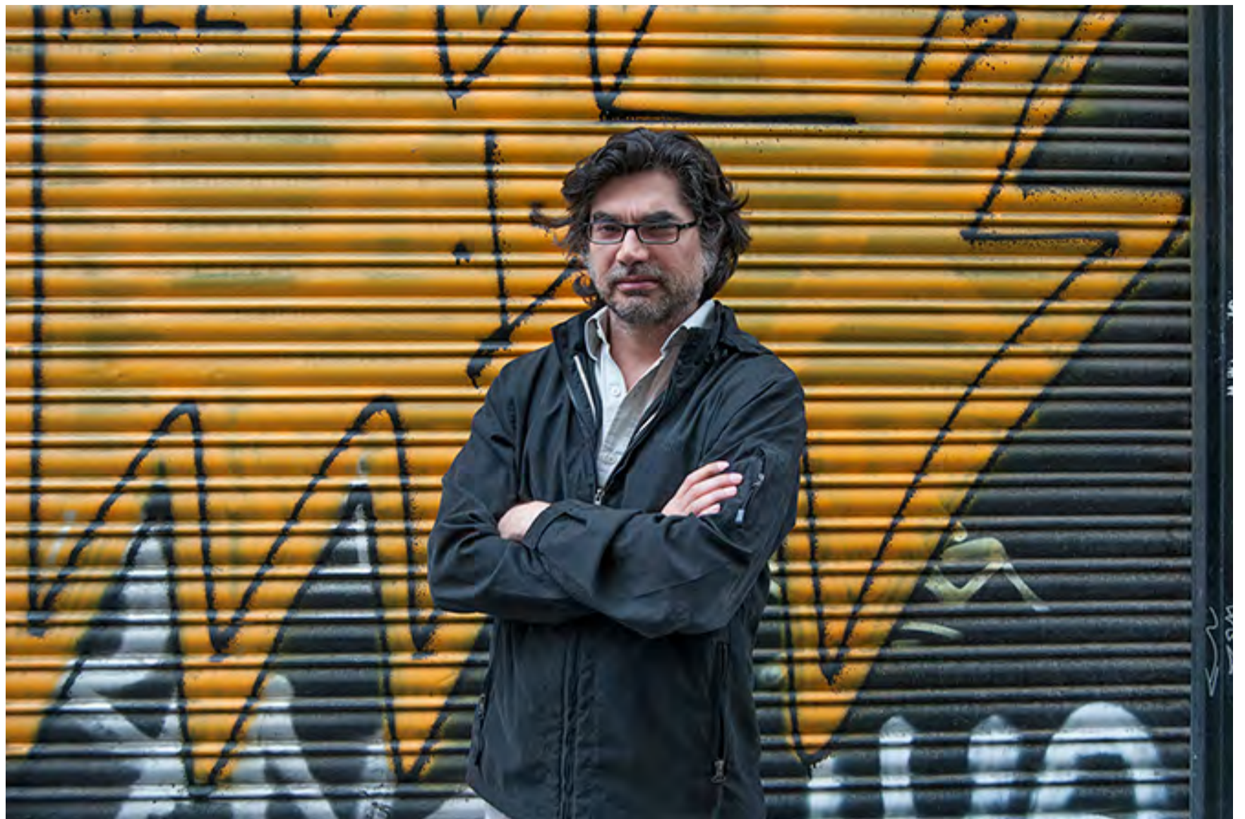
DOMÉNICO CHIAPPE

Hay un pensamiento que habla del victimismo como un fenómeno social extendido: la víctima devenida en figura admirable. Personas que se convierten en héroes, no por lo que hacen sino por lo que les hacen. De hecho, victimizarse es una estrategia habitual en el espacio público. ¿Afecta el victimismo a las víctimas? ¿Las distorsiona, las rebaja?