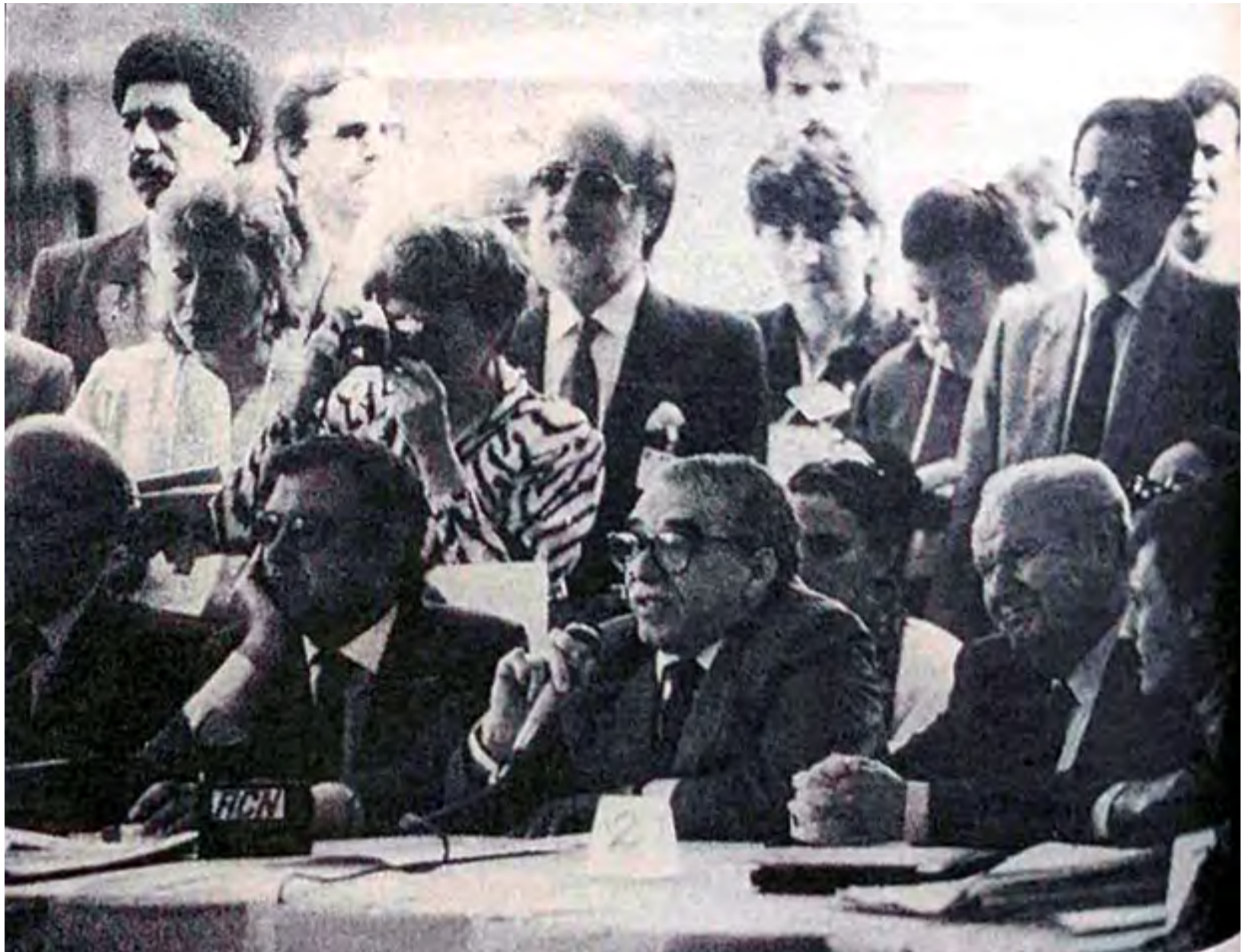
GABRIEL GARCÍA MÁRQUEZ EN LA RUEDA DE PREGUNTA DEL 4 DE FEBRERO DE 1989

El 4 de febrero de 1989, en una histórica rueda de prensa, Gabriel García Márquez hizo al recién electo presidente Carlos Andrés Pérez, una pregunta de excepcional cualidad premonitoria: "Señor presidente: supongamos que hoy es el 4 de febrero de 1994, usted acaba de entregar a su sucesor un país restablecido y en paz al cabo de un gobierno arduo pero fructífero, pregunto: ¿Qué diferencia hay entre esta Venezuela de hoy 4 de febrero de 1994 y la que usted recibió hace 5 años?". Lo que sigue es una elocuente crónica sobre lo ocurrido y las proyecciones de aquel momento capitular