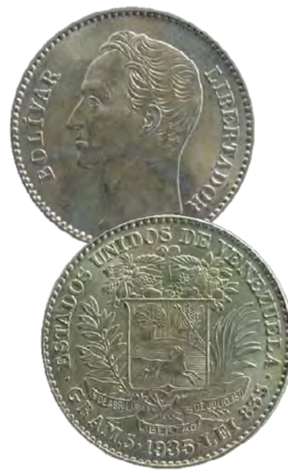
MONEDA VENEZOLANA: UN BOLÍVAR DE 1935

Para esa primera ocasión se buscó el asesoramiento de la Escuela de Negocios de la Universidad de Harvard”