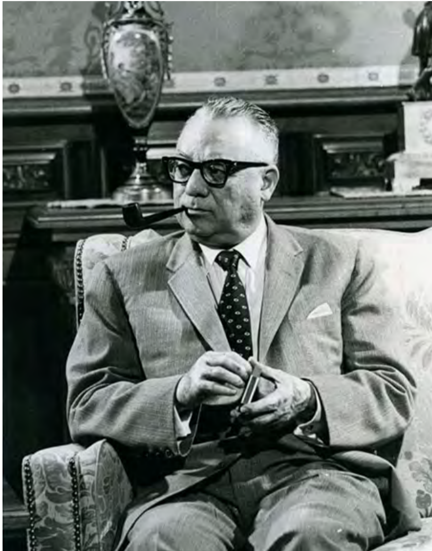
RÓMULO BETANCOURT

Y apenas tenía doce años. Colmó sus precoces aspiraciones en 1958, elegido