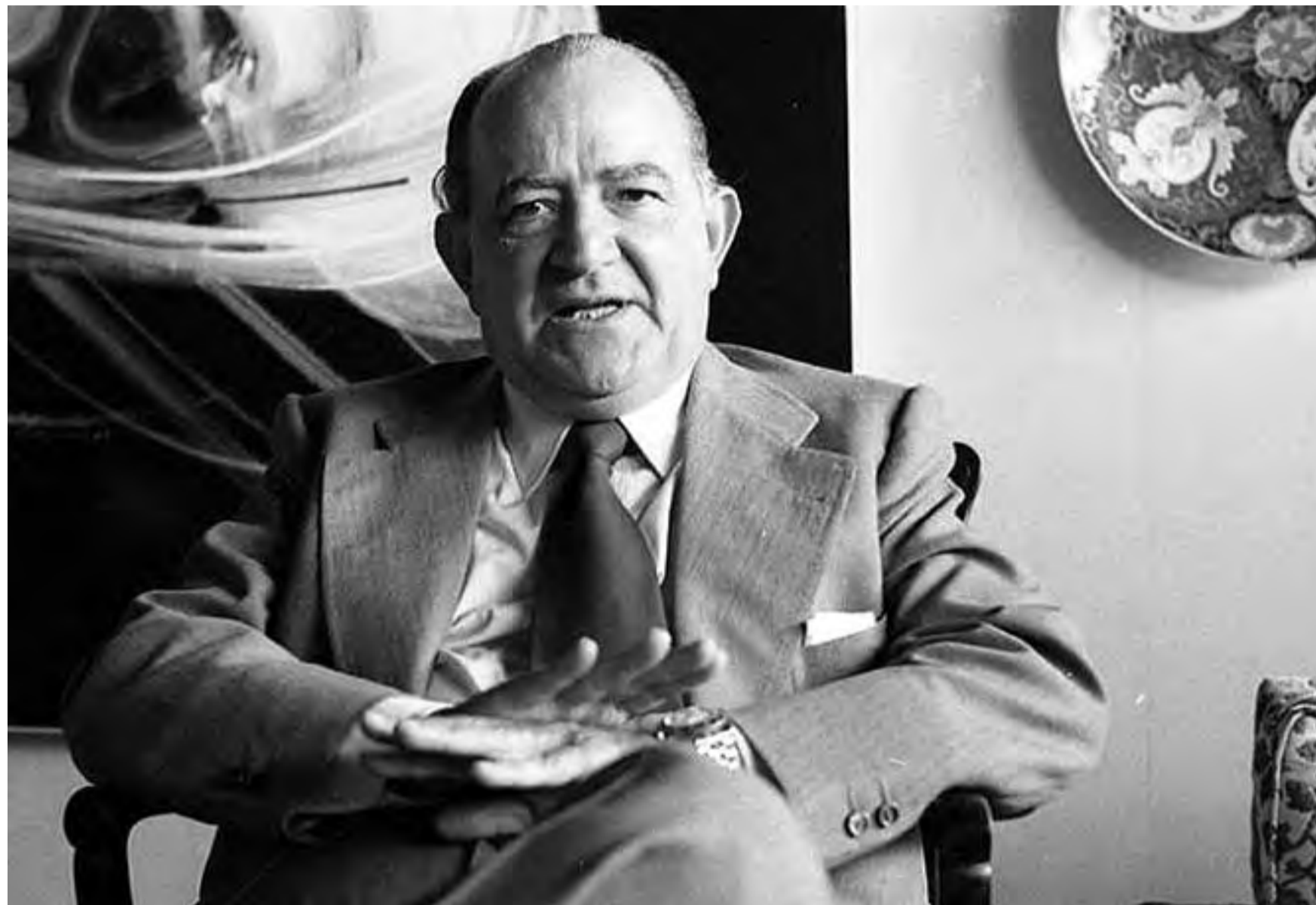
MIGUEL OTERO SILVA

leían. El teatro sí lo veía como actitud definitiva y me gustaba intensamente pero cuando me convencí de que el teatro en Venezuela se queda en el autor, me pasé para siempre al campo de la novela.