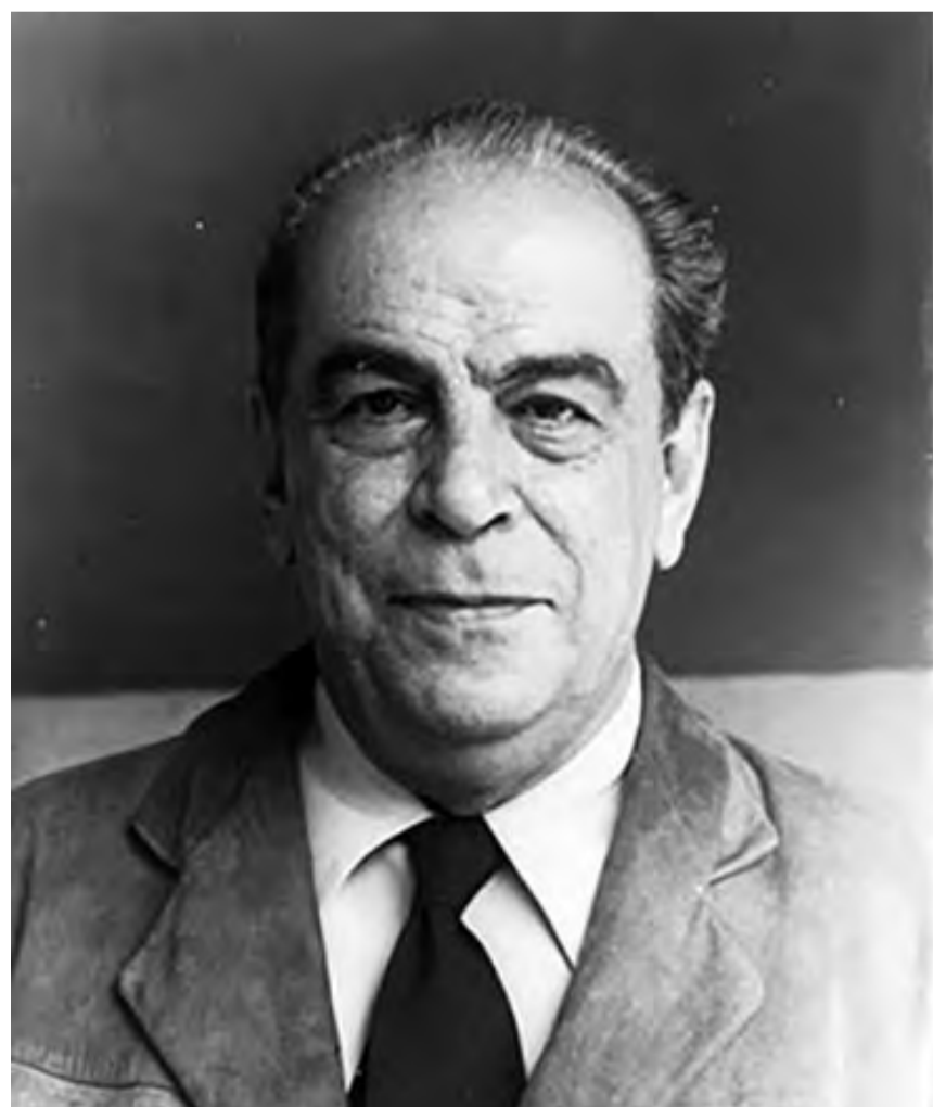
RÓMULO GALLEGOS

E inmediatamente, demostrando con ello que esta última pregunta no la había respondido con toda la sinceridad requerida, el autor de Cantaclaro nos leyó con voz emocionada un hermoso capítulo de Sobre la misma tierra , novela que se está editando y que nada tiene, para él ni para nadie, de “detestable”. ●