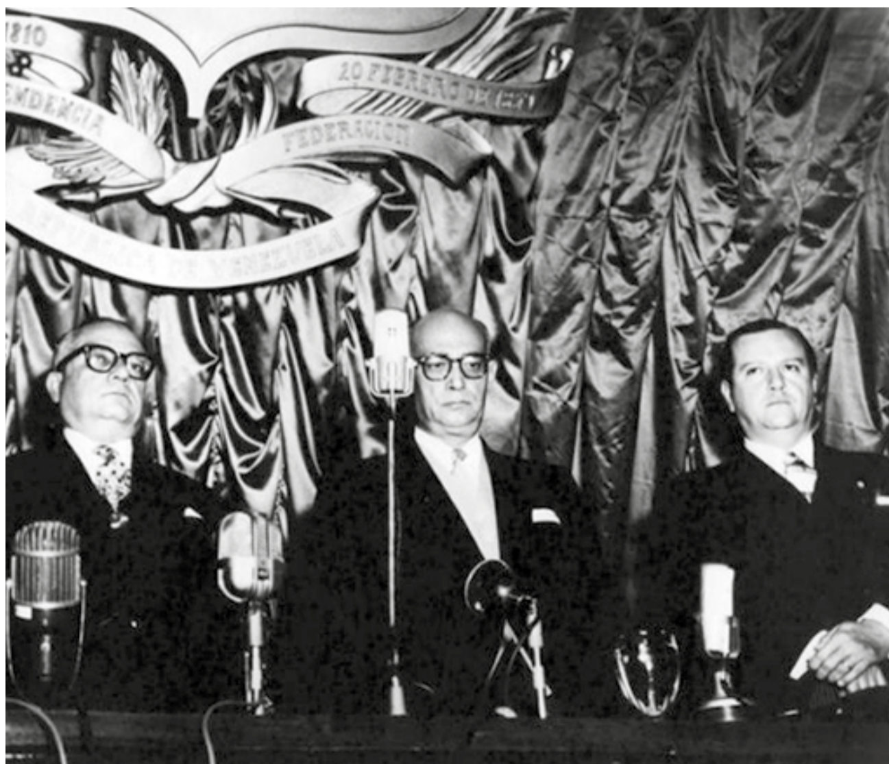
RÓMULO BETANCOURT, RAÚL LEONI Y RAFAEL CALDERA

“ "me he considerado siempre un hombre del común, un venezolano medio”