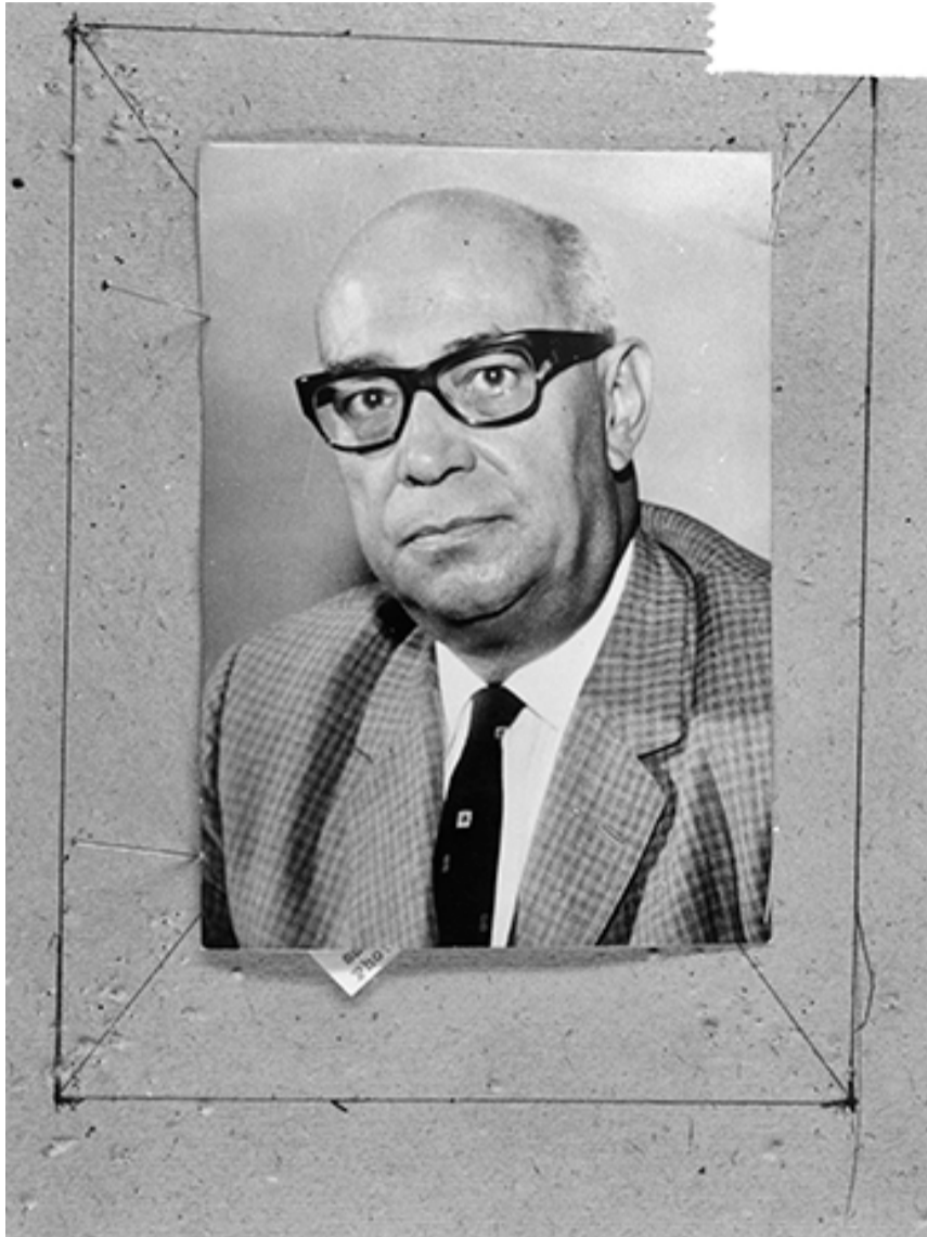
RAÚL LEONI / ANEFO – CREATIVE COMMONS

—En primer término, y como texto de lectura sobrentendido, influyó sobre mi pensamiento la obra del Libertador: su Carta de Jamaica , su mensaje de Angostura, su ideario de libertad y justicia. Luego debo citar el libro de Gil Fortoul, la Historia constitucional de Venezuela , que me proporcionó una visión positivista del pasado de mi país. Más tarde, a las alturas de 1928, leí con pasión a nuestros panfletistas: Pío Gil, Blanco Fombona, Pocatererra, plumas que exaltaban el repudio a las dictaduras, al caudillismo y al servilismo. Al mismo tiempo