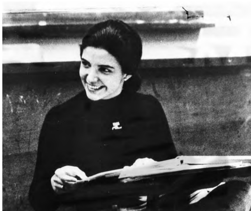
MARÍA FERNANDA PALACIOS / ARCHIVO FAMILIAR