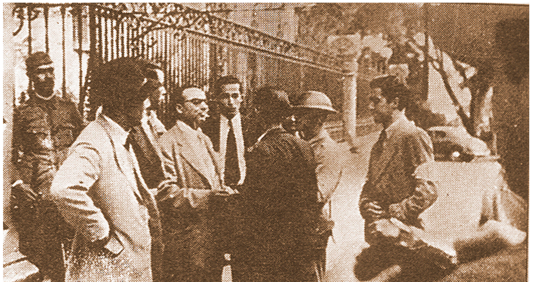
RÓMULO BETANCOURT, MINUTOS DESPUÉS DEL GOLPE QUE DERROCÓ AL GENERAL MEDINA ANGARITA, CONVERSA EN LAS AFUERAS DE MIRAFLORES