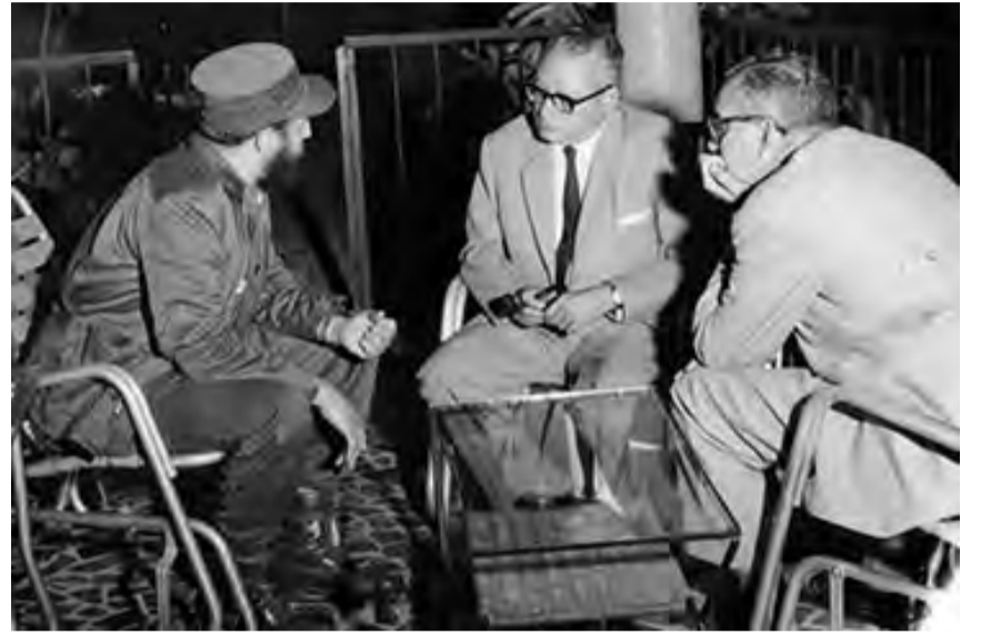
FIDEL CASTRO, RÓMULO BETANCOURT Y FRANCISCO PÍVAL

por el voto mayoritario del pueblo venezolano (ya las había satisfecho antes a medias, o a quintas, en 1945, por la vía no tan doctrinaria del golpe de Estado), y ahí lo tenemos en el solio presidencial. De acuerdo con la teoría de las probabilidades, no se le concedía ninguna de finalizar su período, sino todas de salir con las tablas en la cabeza, a semejanza del cien por ciento de los presidentes emanados de consulta pública en el curso de nuestra historia. Los logros de los apostadores eran francamente adversos al cumplimiento de su mandato: