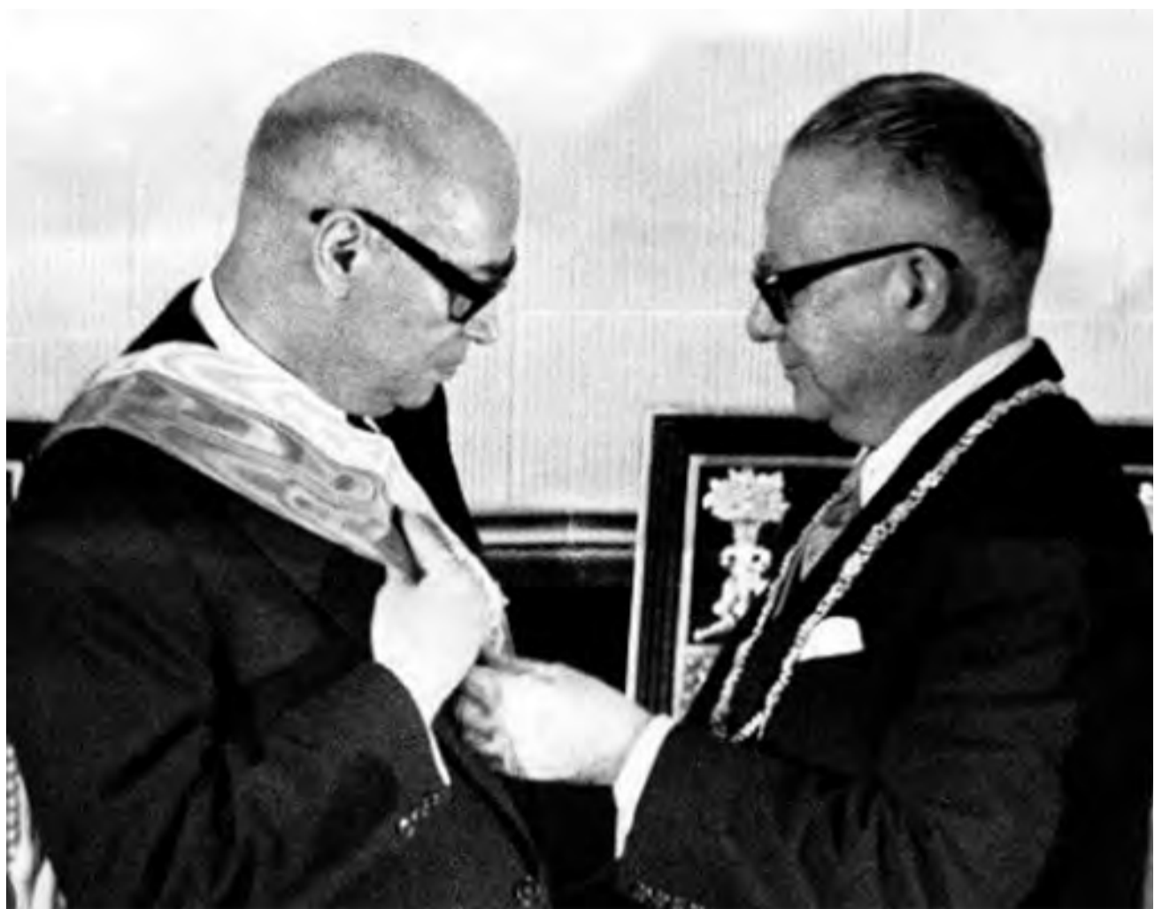
RAÚL LEONI Y RÓMULO BETANCOURT

saciones de imposición sucesoral, tan accidentadas en la historia de Venezuela. “ Qui nescit dissimulare nescit regnare ”, dijo el maestro Maquiavelo. A juicio del periodista, el candidato presidencial de Rómulo Betancourt no podía ser otro sino Raúl Leoni. Lo era desde la frutería de Barranquilla, sí señor).