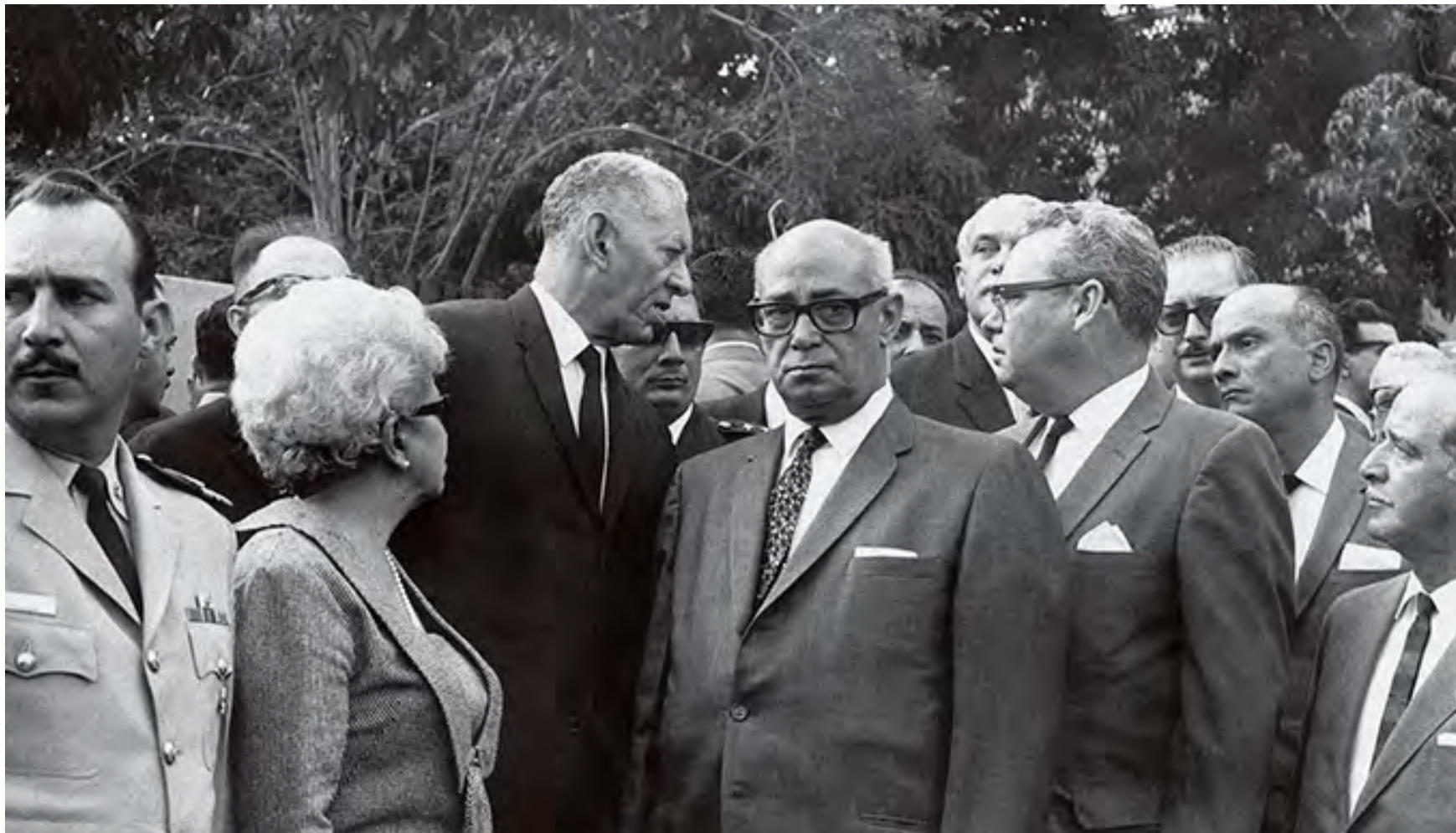
LUIS BELTRAN PRIETO FIGUEROA Y RAÚL LEONI