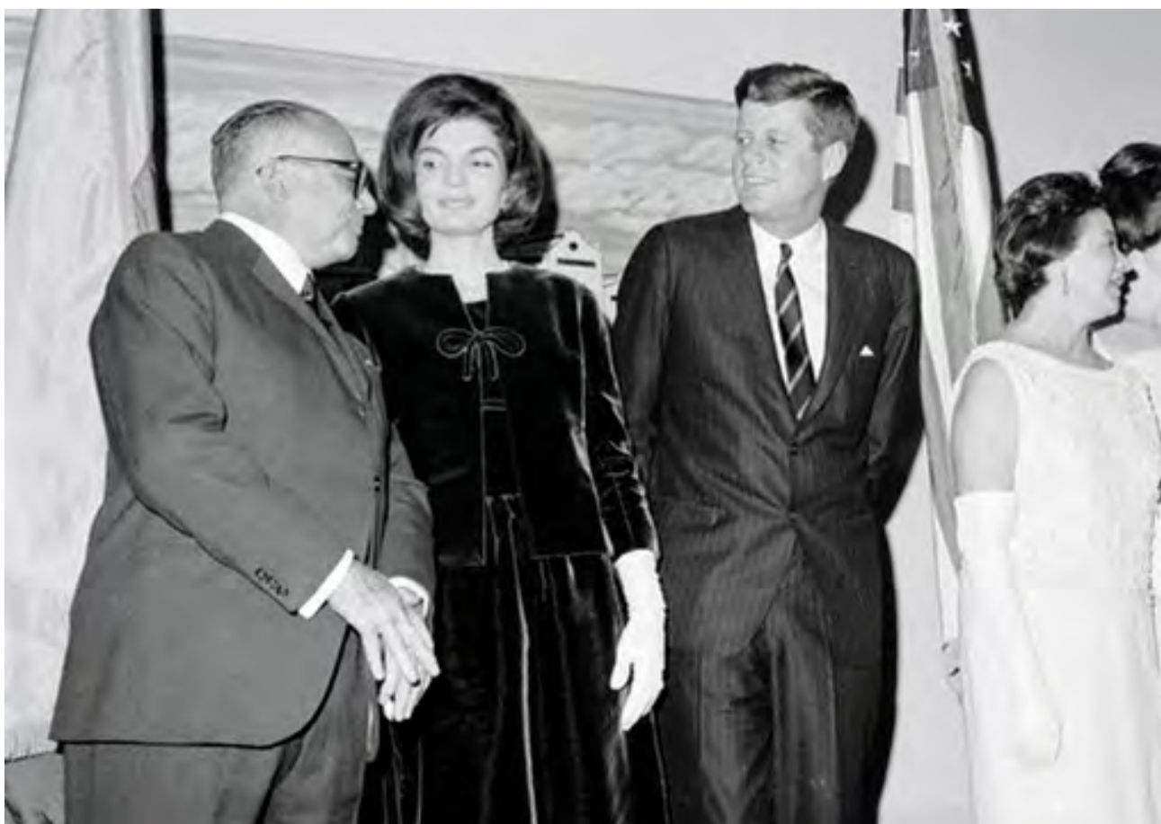
RÓMULO BETANCOURT, JACQUELINE KENNEDY Y JOHN. F. KENNEDY

—Absolutamente nada. En eso soy profunda mentesincero. Se trata de una pequeña lección de pedagogía cívica. Quiero que sean los partidos quienes discutan los candidatos y no inmiscuirme para nada en el problema electoral. Y en Venezuela nos conocemos muy bien. Es decir, que si yo en este problema estuviera haciendo un doble juego, si te dijera públicamente lo que te estoy diciendo y actuara en otra forma, eso trascendería.